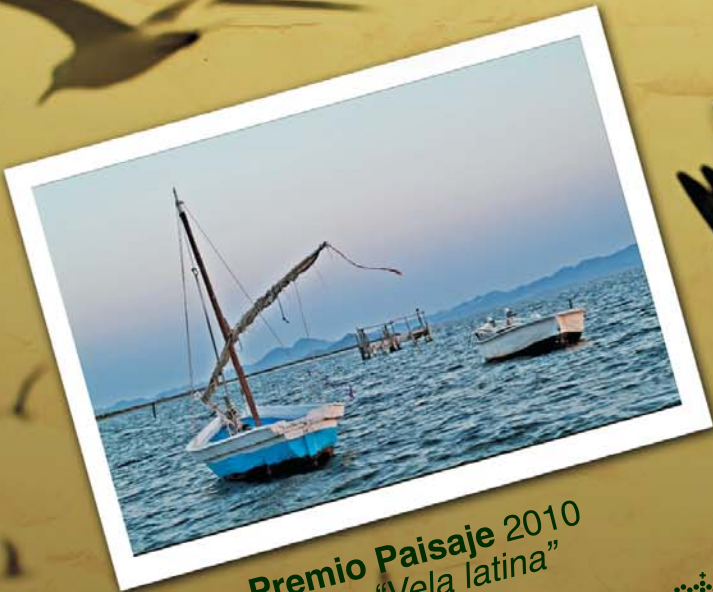
Premio Paisaje 2010 Título: "Vela latina"