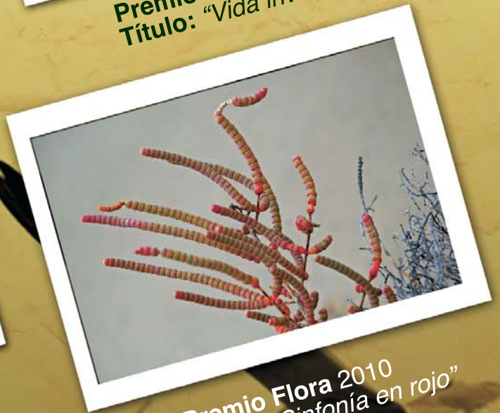
Premio Flora 2010 Título: "Sinfonía en rojo"